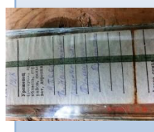
Раздел, посвященный Н.И.Крысанову