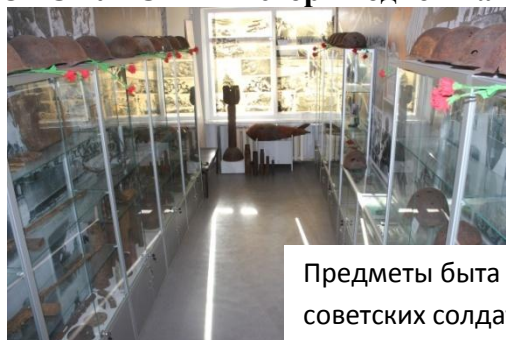
Предметы быта и вооружения советских солдат