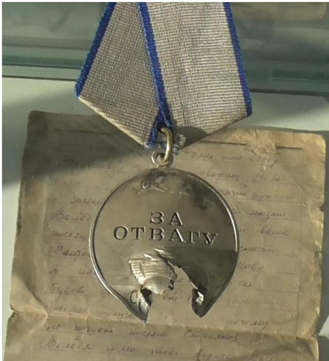
Центральный экспонат музея медаль “За Отвагу”