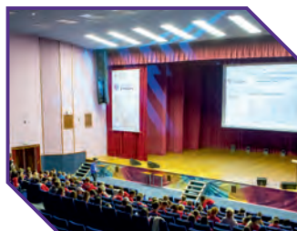
Молодежный киноконцертный центр Российского университета кооперации