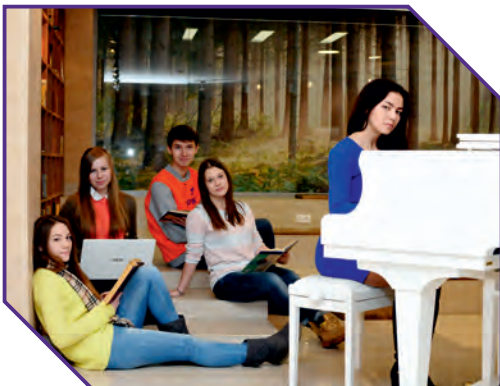
Головной вуз. Зона самоподготовки студентов