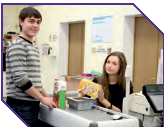
Учебный магазин (лаборатория) Российского университета кооперации