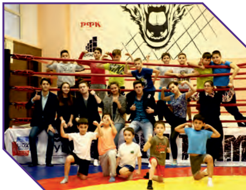
Тренировочный зал Российского университета кооперации