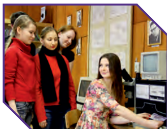
Лаборатория криминалистики Российского университета кооперации